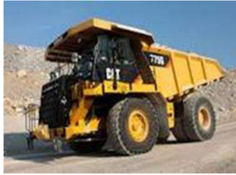
4- Huit de ces monstres de 60 tonnes vont rouler jour et nuit 365 jours/année

Le projet se situe dans la région du bassin versant de la Petite Nation. Cinq grands lacs sont présents, dans lesquels des affluents intermittents et pérennes se jettent. Il s'agit du lac Bélanger, du lac Doré, du Petit Lac Vert, du lac Tallulah et du lac Garault. Les plans d'eau lacustres couvrent 11 % de la superficie totale du projet La Loutre tandis que les écosystèmes de terres humides (tourbières, marécages, marais) couvrent 6 % de cette superficie. Il est mentionné dans l'EEP que des ruisseaux seront déviés et que des milieux humides seront détruits.