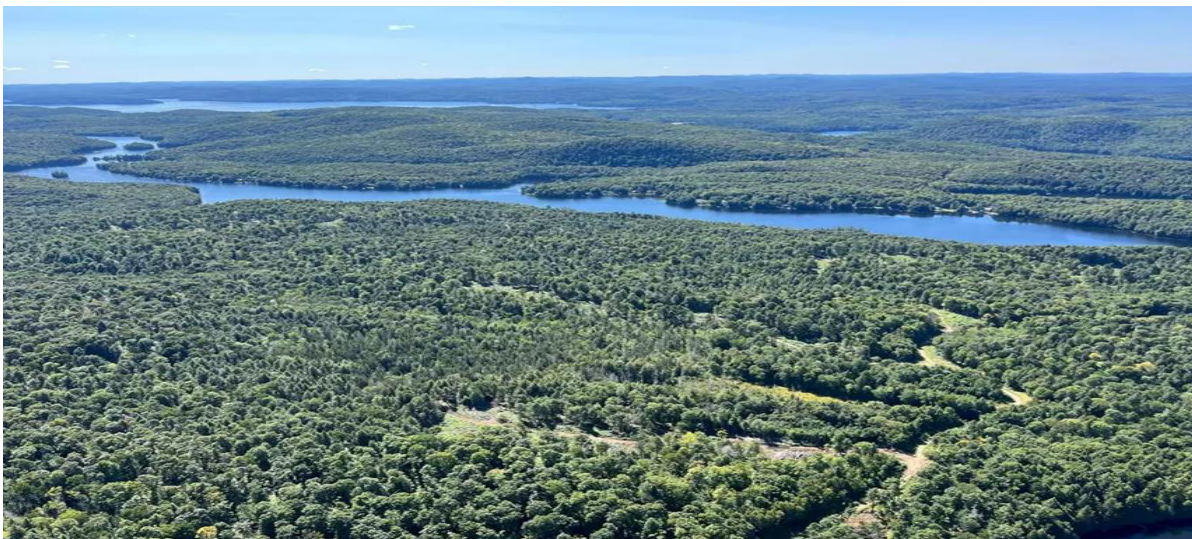
2- On remarque à l'avant-plan les chemins créés par Lomiko Metals Inc. dans le cadre de sa campagne de forages exploratoires l'été dernier, au centre le lac Doré et à l'arrière-plan, le lac Simon

Ce mégaprojet d'exploitation serait situé en bordure de notre lac (Fig.2) sur le territoire de la municipalité Lac-des-Plages et de la Première Nation Kitigan Zibi Anishinabeg (KZA).