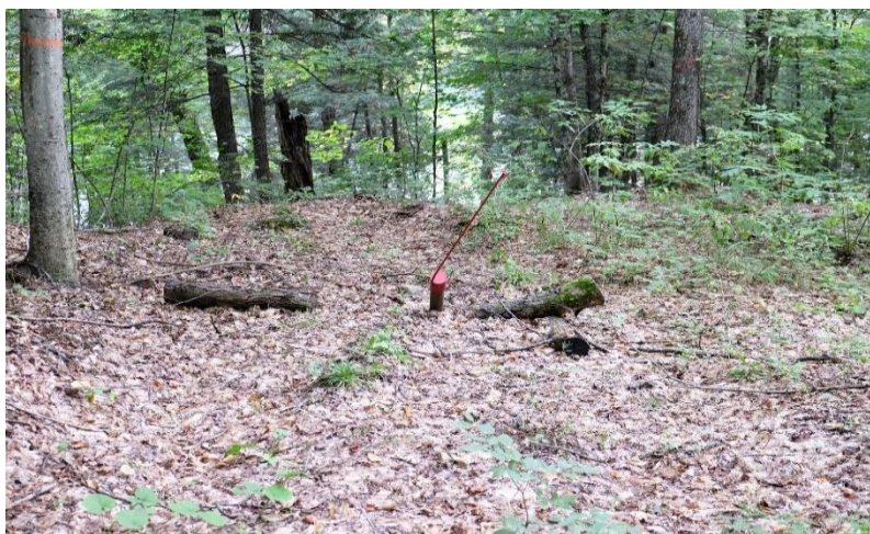
5- Un carottier, vestige du programme de forage de Lomiko l'an dernier

L'exploitation minière implique des activités telles que le dynamitage, le fonctionnement continu de machineries lourdes, et la circulation fréquente de tombereaux. Tout cela générera des niveaux sonores élevés, entraînant une augmentation significative du bruit dans la région. Les travaux de forages exploratoires étant requis pour la conservation des claims de son projet La Loutre, Lomiko Metals Inc. a pu, sans avis, ni permis, envahir, perforer et blesser notre territoire l'été dernier.